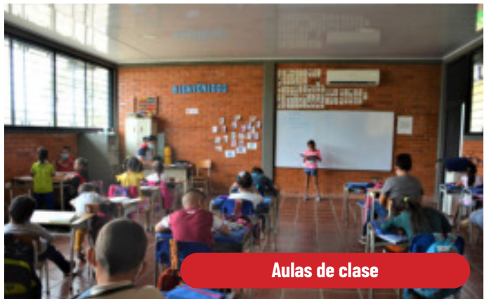
Aulas de clase